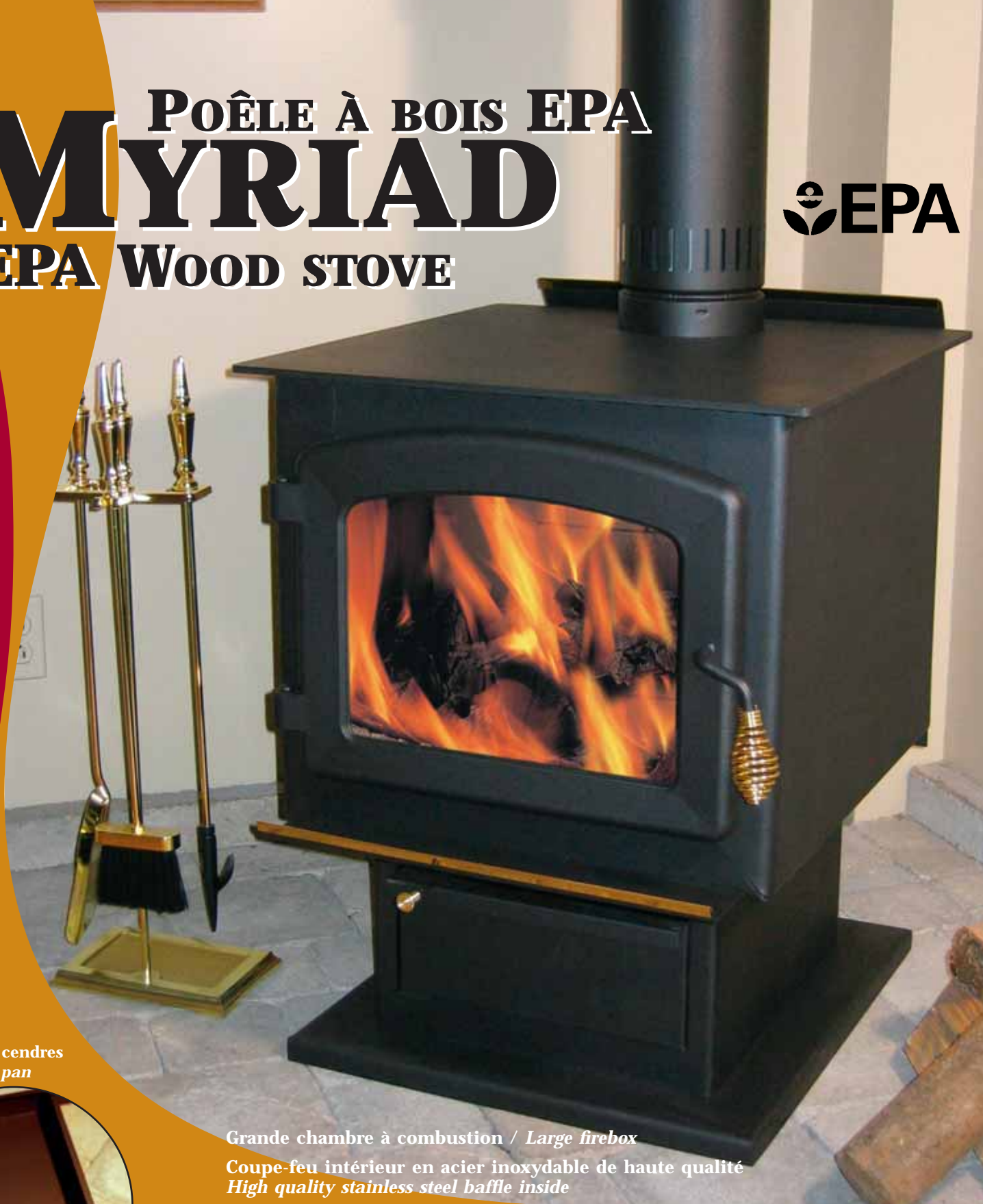
Tiroir à cendres Ash pan